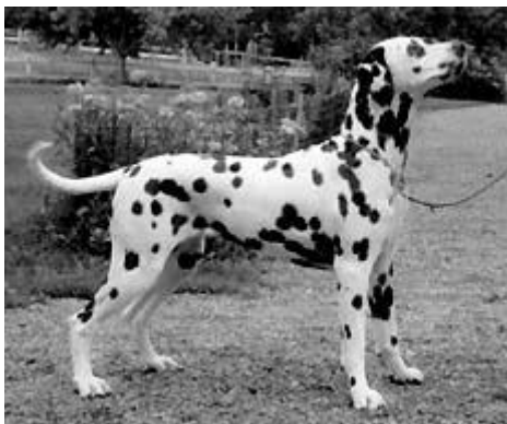
Dallas Leading Lady

Skuldre og overarm skal være normalt vinklet, det samme gjelder bakpartiet. I Sverige har de et godt uttrykk for dette, nemlig ordet ”lagom”, dvs. passe. Det er viktig at hunden ikke er overdrevet vinklet bak og rak i fronten eller omvendt, da dette gir en ubalanse i bevegelsesmønsteret. Dette er en vanlig feil hos dalmatiner, som vi ønsker at dommerne skal være oppmerksom på. Se bildet under, samt fig. 1 og 2: