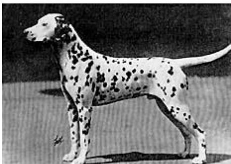
Ch Snow Leopard